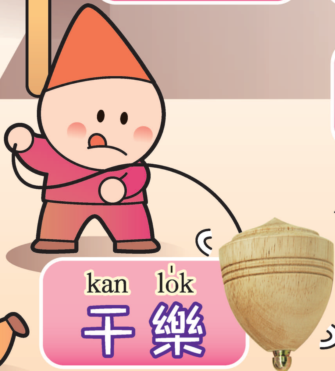
kan lók 干樂