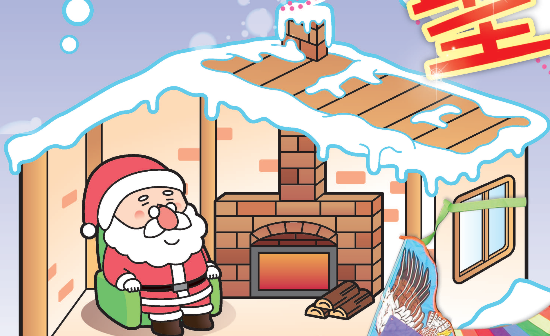
hong tshue 風吹