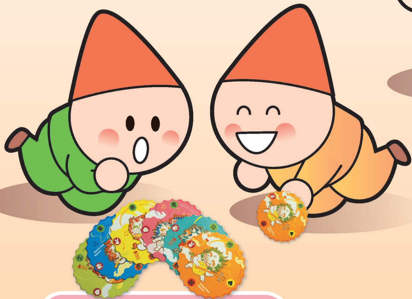
ang á phiau 甯仔標